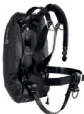
Крыло WTX 3 с мягкой подвесной системой WTX