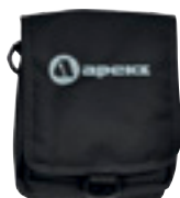
Малый карман для аксессуаров