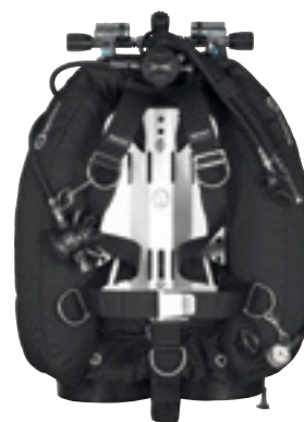
Крыло WTX D-30 PSD со спинкой Ultralight и подвеской в виде моностропы