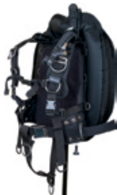
Крыло WTX D-30 с алюминиевой спинкой, подвеской в виде моностропы и грузовой системой SureLock на адаптере