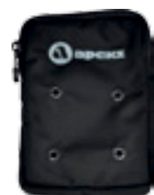
Большой карман для аксессуаров