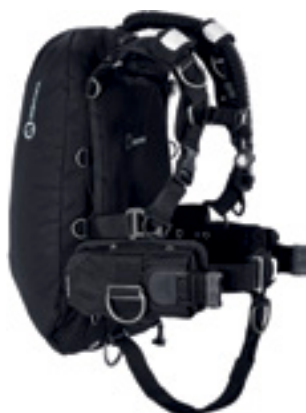
Крыло WTX D-40 с мягкой подвеской WTX и грузовой системой SureLock