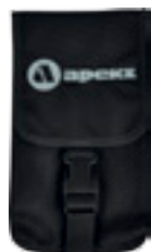
Сетчатый карман для маски