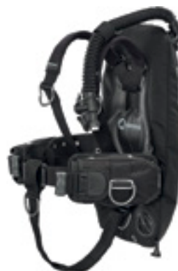
Крыло WTX D-18 со спинкой Ultralight, подвеской в виде моностропы и грузовой системой SureLock на адаптере