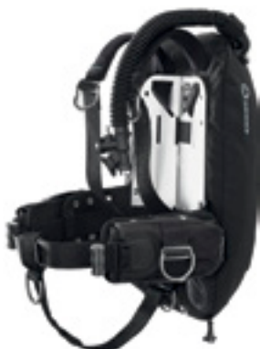
Крыло WTX D-34 со стальной спинкой и подвеской в виде моностропы, комплект ТЕКЗ, манифолд с изолятором, комплект баллонных колец 180 мм.