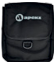
Карман на бедро

Линейка карманов для аксессуаров, которые были разработаны специально для размещения на компенсаторах плавучести WTX. Кроме того, вы можете закрепить карманы на грузовом поясе или бедре.